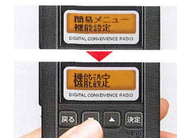
縦倍角メニュー表示

4つのキーによるカンタン操作で、いろいろな機能設定が可能。漢字対応の液晶画面では大きいフォント4文字でチャンネル番号を表示します。よく使う機能設定は最大6文字表示、さらに見やすさを優先した縦倍角表示に切替設定できます。