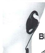
BM-GSRE2.5 D型 イヤホン2.5mm