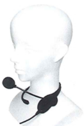
B-N01nz* ネック型 ノイズキャンセリングマイク