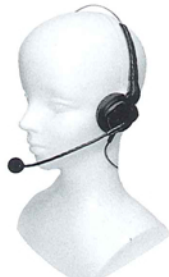
B-H02 標準型ヘッドホンマイク