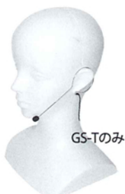
GS-Tのみ BM-GSHM ヘッドセットマイク3.5mm