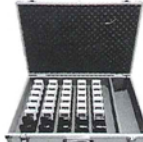
BM-GSC40 専用充電器 40台用