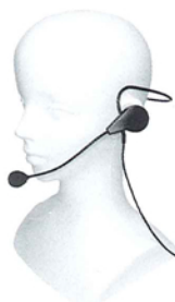
B-H01 耳掛け型ヘッドホンマイク