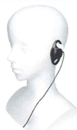
BM-GSRE3.5 D型 イヤホン 3.5mm