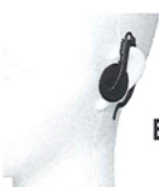
BM-GSRM2.5 耳掛け式 イヤホン2.5mm