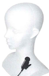
BM-GSVS* ピン型 ノイズキャンセリングマイク *専用イヤホンが必要となります