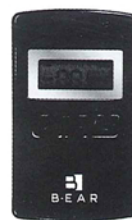
BRIDGECOM GS-T 送信機