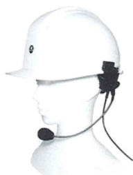
B-E03wpnz* ヘルメット取付型 ノイズキャンセリングマイク