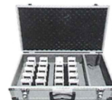
BM-GSC20 専用充電器 20台用