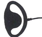
D型イヤホン (GS-Rに付属)