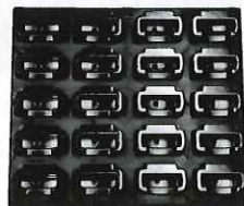
BM-DAC20 専用充電器20台用(ケース無)