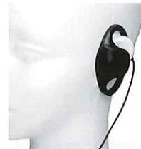
BM-GSRE2.5 D型 イヤホン2.5mm