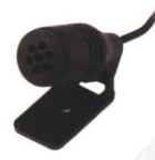
サンバイザーマイク* GMMN4065

※印のアクセサリを使用する際には、データ通信ケーブル(CT-147)が必要です。