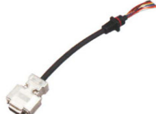
データ通信ケーブル CT-147