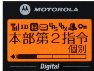
〈ディスプレイ:実物大〉

世界各国で政府機関向けの無線機を供給し、高い評価を得ているモトローラだからこそできる製品(本体)2年保証です。