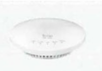
AP-95M アクセスポイント