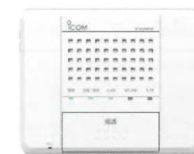
無線IPインターコム IP200PG