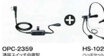
OPC-2359 通話スイッチ内蔵型 接続ケーブル(電子ロック式)