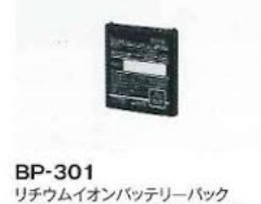
BP-301 リチウムイオンバッテリーパック 3.8V, 1960mAh (min.) 2020mAh (typ.)