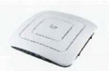
AP-9500 #11 アクセスポイント