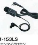
HM-153LS イヤホンマイクロホン