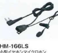
HM-166LS 小型イヤホンマイクロホン