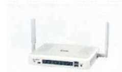
SR-7100VN #31 SIPサーバー