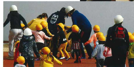
地域防災・ レクリエーションに