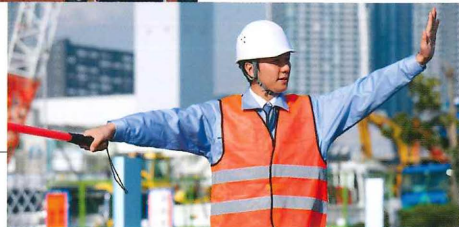
建設・ 工事現場でも