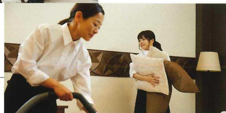
ホテルなどでの 清掃作業に