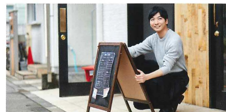
フロアが分かれた 店舗などで

スタッフ同士のコミュニケーション向上に最適 飲食業や建設業、地域防災はじめ、多彩な業界やシーンで活用可能