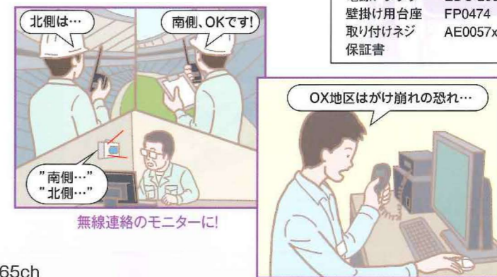
無線ネットワークのモニターに!