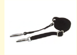
防爆用ショルダーストラップ (NTN5243) GMLN1111用