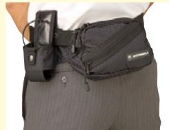
防爆用ウエストバック (MDRLN4815)