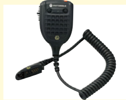
防爆用リモートスピーカマイク 音量切替付き (GMMN1111)