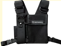
防爆用チェストバック (MDHLN6602)