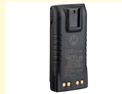
GP329Ex防爆用リチウムイオン充電電池 1480mAh (NNTN5510CR)