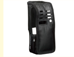
防爆用ソフトレザークース (GMLN1113)