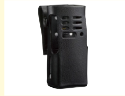
防爆用ハードレザークース (GMLN1111)