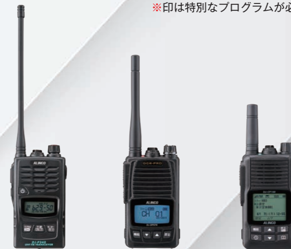
DJ-P240L ※ 特定小電力