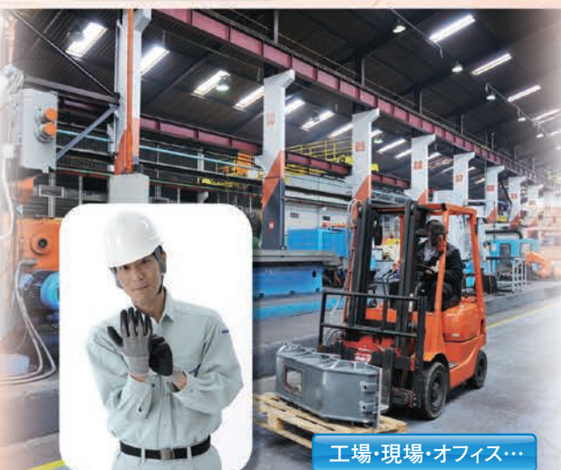
工場・現場・オフィス...