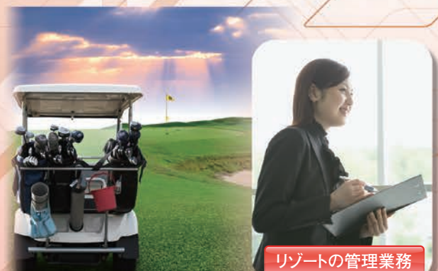
リゾートの管理業務