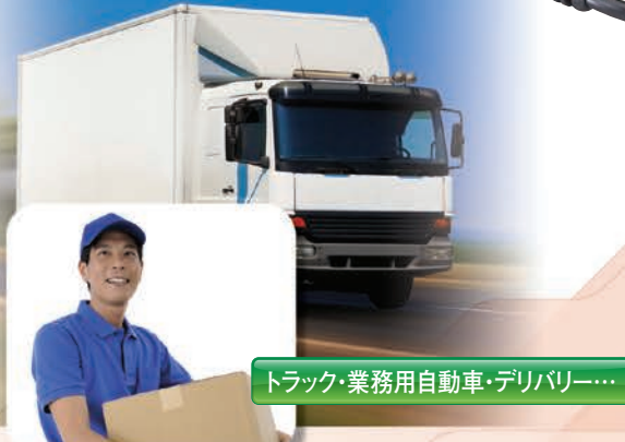
トラック・業務用自動車・デリバリー...

モニターキーを第2PTTキーとして割り当て、2つのチャンネルを交互スキャンで待ち受けるデュアル・オペレーション機能