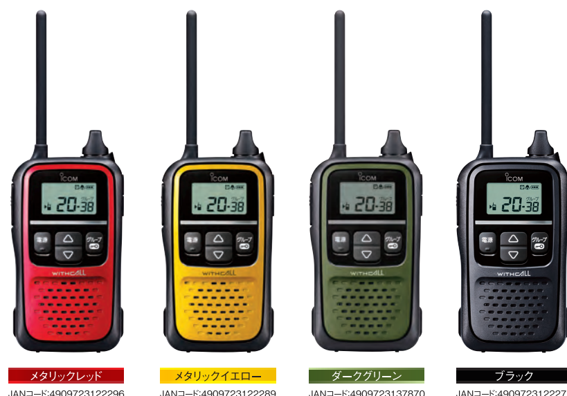
メタリックレッド JANコード:4909723122296 メタリックイエロー JANコード:4909723122289 ダークグリーン JANコード:4909723137870 ブラック JANコード:4909723122272