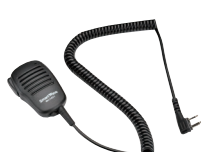
スピーカーマイク SK-M01 (スピーカー出力 0.5W 3.5φイヤホン端子付き)

※運転中のイヤホン、ヘッドホンの装着は各都道府県の条例で規制されている場合があります。