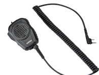
大音量防水スピーカーマイク MP68 (IP67*相当 防水・防塵性能、 スピーカー出力2W 3.5φイヤホン端子付き)