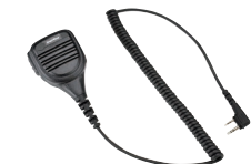
大音量スピーカーマイク MP16 (IP54*相当 防水・防塵性能、 スピーカー出力2W 3.5φイヤホン端子付き)