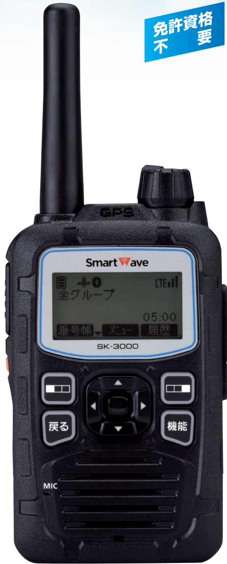
実寸大 重量 約250g (アンテナ、Li-ionバッテリーパック装着時)