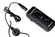
Bluetooth® イヤホンマイク SK-M03