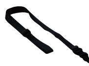
ネック ストラップ SK-T03