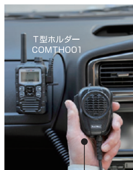
大音量防水スピーカーマイク MP68