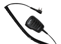
防水スピーカーマイク SK-M04 (IP67*相当防水・防塵性能 スピーカー出力 0.5W)