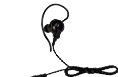
スピーカーマイク用 イヤホン SK-E01 (ケーブル長 約0.5m)