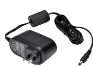
急速充電器用ACアダプタ SK-P03