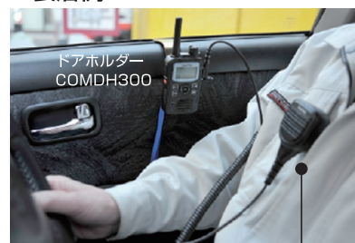
大音量スピーカーマイク MP16