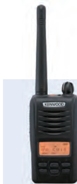
デジタル簡易無線 携帯型登録局対応無線機 D503シリーズ