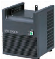
ベース用 スピーカー付き電源 KBS-1