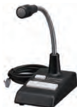
ベース用 スタンドマイクロホン KMC-53