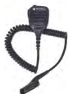
PMMN4067 IMPRES™ リモートスピーカーマイク