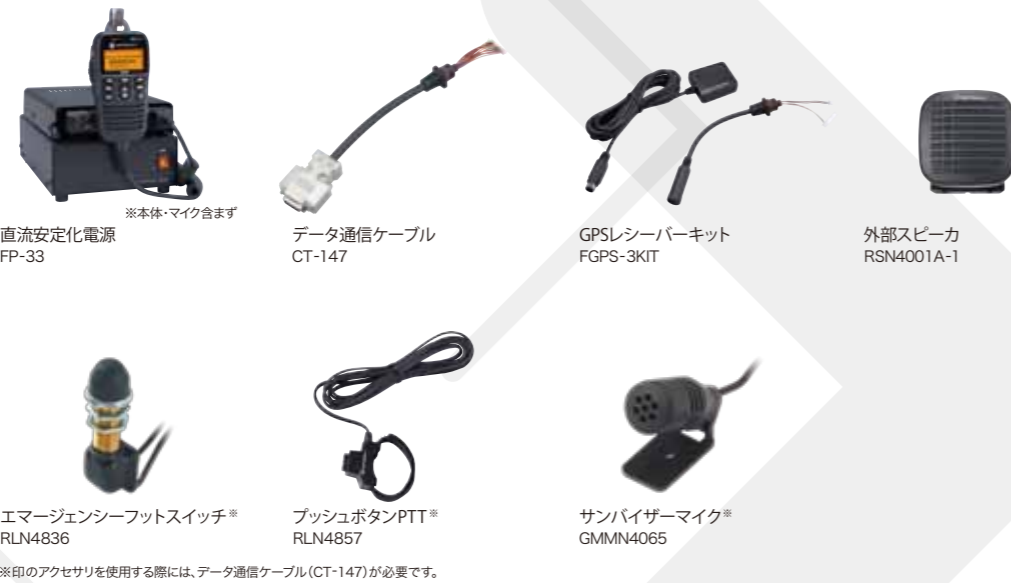
※本体・マイク含まず 直流安定化電源 FP-33 データ通信ケーブル CT-147 GPSレシーバキット FGPS-3KIT 外部スピーカ RSN4001A-1 エマージェンシーフットスイッチ* RLN4836 プッシュボタンPTT* RLN4857 サンバイザーマイク* GMMN4065 ※印のアクセサリを使用するには、データ通信ケーブル(CT-147)が必要です。