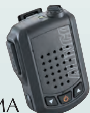
ワイヤレス・スピーカーマイク 音声出力3W EMS-87B