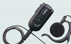
ワイヤレス・イヤホンマイク EME-80BMA