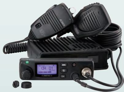
別売の EDS-9 と EMS-501 装着時