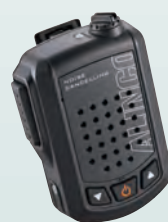
高性能ノイズキャンセラー内蔵 ワイヤレス・スピーカーマイク 音声出力3W EMS-87BNC