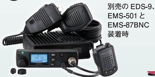
別売の EDS-9、EMS-501 と EMS-87BNC 装着時