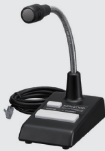
ベース用 スタンドマイク KMC-53