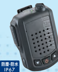
EMS-87B Bluetoothスピーカーマイク