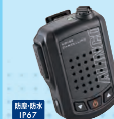
EMS-87BNC ノイズキャンセル内蔵 Bluetoothスピーカーマイク