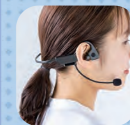
EME-SW025 【鞍旋品】ワイヤレス骨伝導ヘッドセット