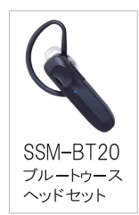
SSM-BT20 Bluetooth ヘッドセット

オプションの Bluetooth ヘッドセット SSM-BT20 を使用したワイヤレス通信が可能です。SSM-BT20 はノイズキャンセル機能によるクリアな送信音質で業務連絡をサポートします。SSM-BT20 は一度の充電で約 20 時間使用することができます。(使用時間は、同時通話連続運用時を想定)