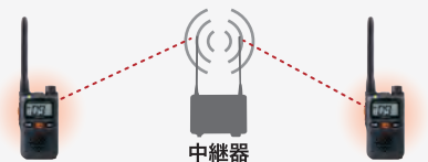
中継器接続で交互通話の約2倍にエリアを拡大

交互通話に加え、中継通話用チャンネルを装備しており中継器に接続することで交互通話の約2倍に通話エリアを拡大できる他、多層階のビル内や別棟との連絡、不感エリアの改善などに利用が可能です。