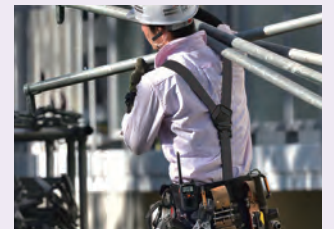
ケーブルレス Bluetooth利用イメージ