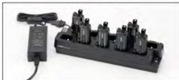
EDC-345Aツイン充電器セット スタンドEDC-346とACアダプターEDC-162

いずれも約4時間で内蔵電池をフル充電。継ぎ足し充電もできます。スタンドに載せたラベルトークを無償のスマホアプリで設定できます。 ※ EDS-39 USBケーブル ¥1,320 / EDC-328 USBアダプター ¥2,530 を使用して1台だけを充電することもできます。市販のアダプターやケーブルも使えます。 ※ 充電中は送信できません。