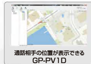
通話相手の位置が表示できる GP-PV1D