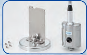
連結ケーブル 5m付属します。